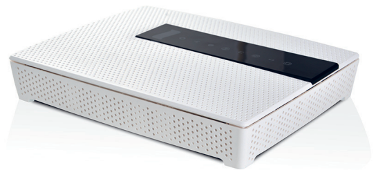
Tarkista laitteen hinta ja tekniset ominaisuudet: dna.fi/modeemit

DNA tarjoaa uuden DNA Netin käyttöönottajalle DNA Valokuitu Plus -reitittimen (1 kpl/asunto). Nouda laite lähimmästä DNA Kaupasta tai soita asiakaspalveluun. Laitte on noudettavissa 15.12.2019 asti, jonka jälkeen sen hinta on 127 €.